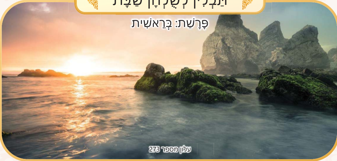
עלון מספר 273

נא לא לקרוא בשעת התפילה וקריאת התורה. העלון טעון גניזה. הלימוד בשבת פי אלף מיום חול. כדאי לקרוא בשלחן שבת.