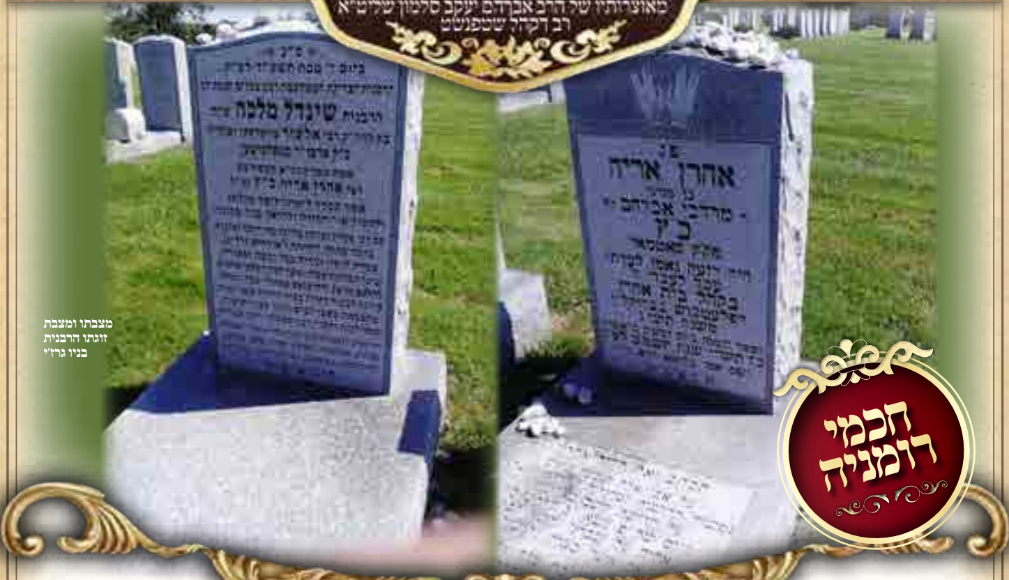
מצבתו ומצבת זוגתו הרבנית בניו גרזי