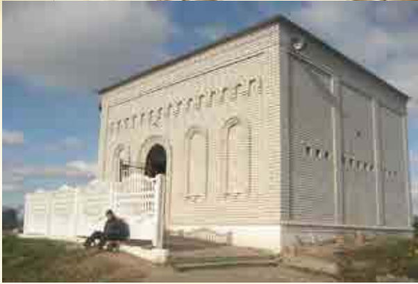
אהל ציון קדשו של הרה"ק סגנון של ישראל מברדיטשוב